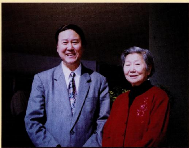
斯霞与全国小语会会长崔峦合影（1999年）