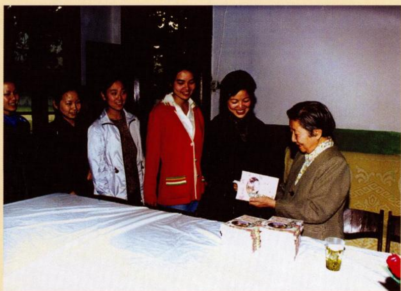
向青年教师赠送《爱心育人》（2000年）