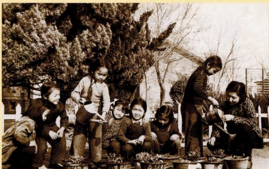
斯霞重视培养学生的劳动习惯（1958年）