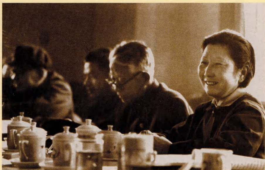
参加省人大五届一次会议（1978年）