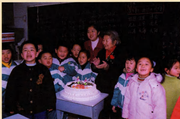
南师附小的学生祝贺斯霞92岁生日快乐（2001年）