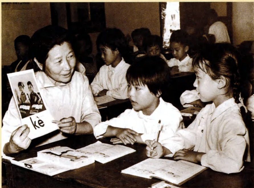
斯霞指导学生学习汉语拼音（1980年）