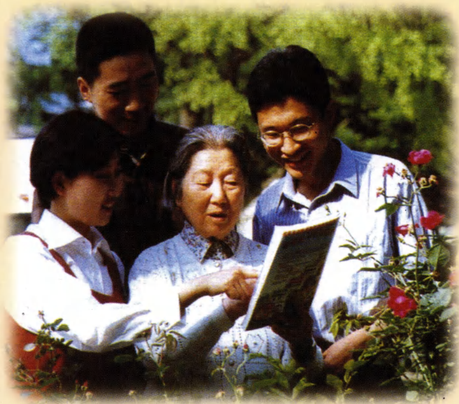
和青年教师探讨教学问题（1998年）