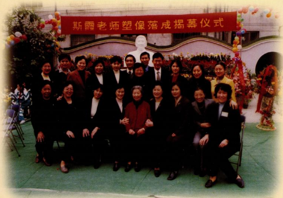
和南师附小部分教师在斯霞塑像前合影（1999年）