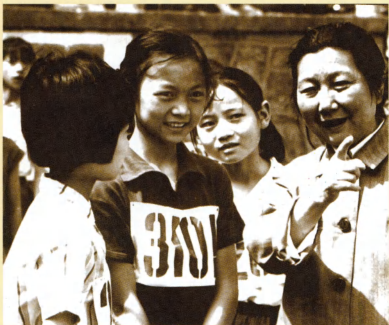
斯霞鼓励小运动员努力拼搏，取得好成绩（1983年）