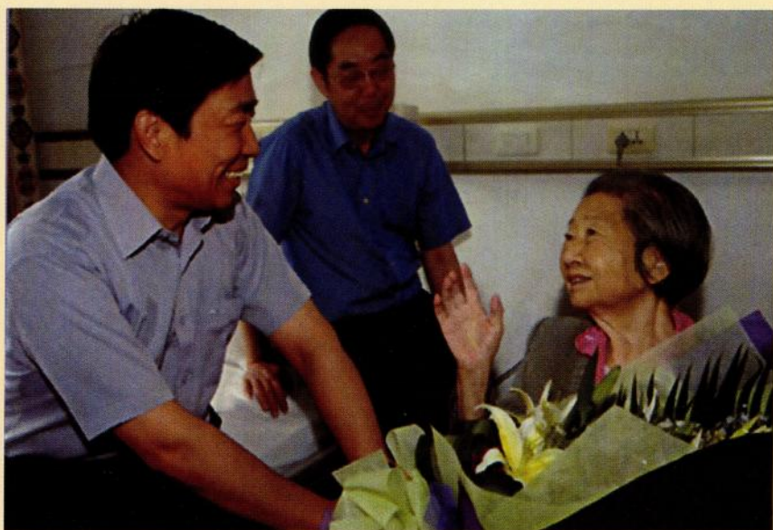
原江苏省委书记李源潮看望病中的斯霞（2003年）