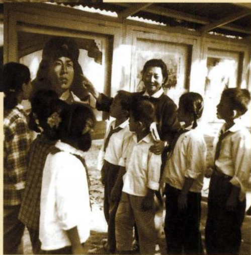
斯霞带学生参观雷锋事迹展（1963年）