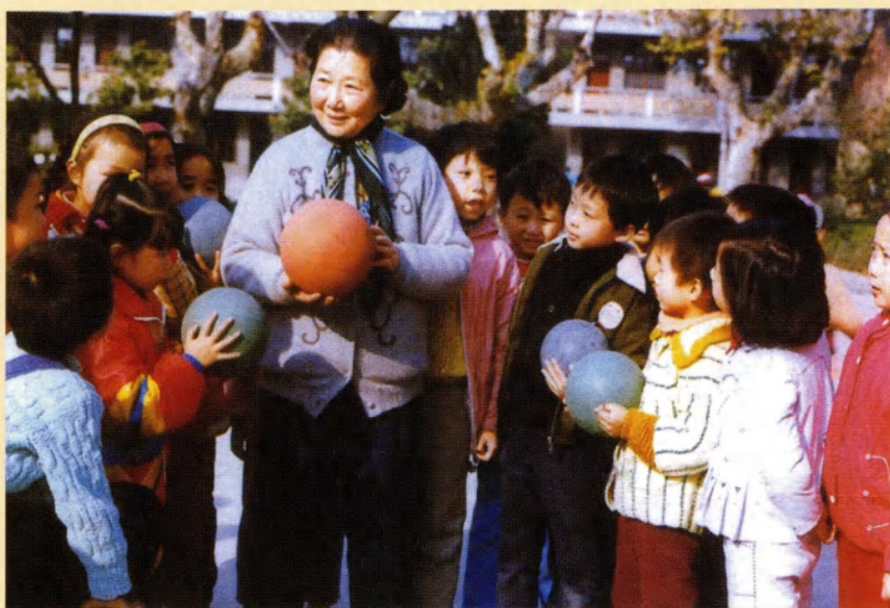
斯霞鼓励孩子们积极参加体育锻炼（1996年）