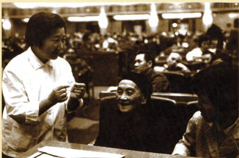
斯霞在全国人大代表会上和各地代表共商提案（1983年）