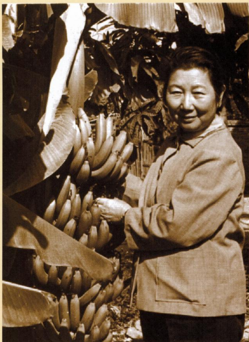
赴广西南宁讲学（1979年）