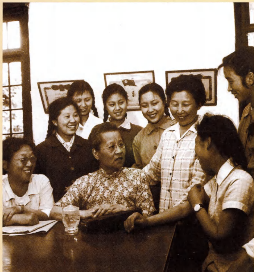
吴贻芳副省长和南师附小的青年教师亲切交谈（1963年）