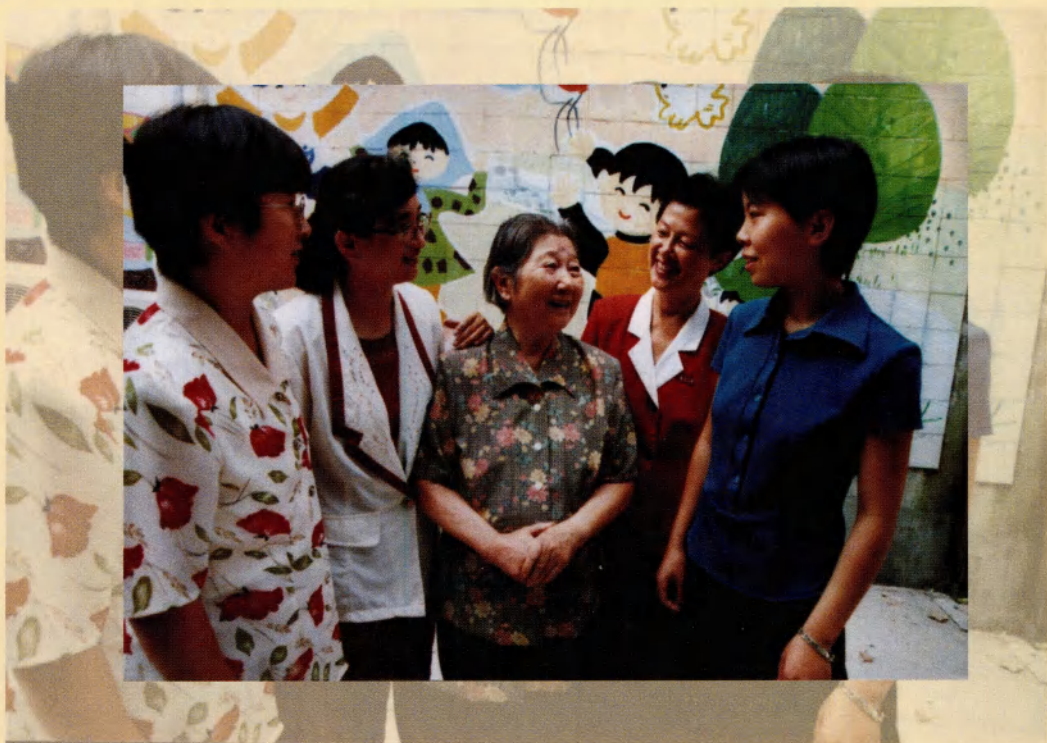
和来校参观的外地青年教师亲切交谈（1995年）