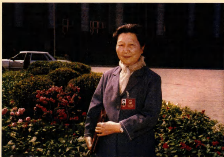
全国人大代表斯霞（1985年）