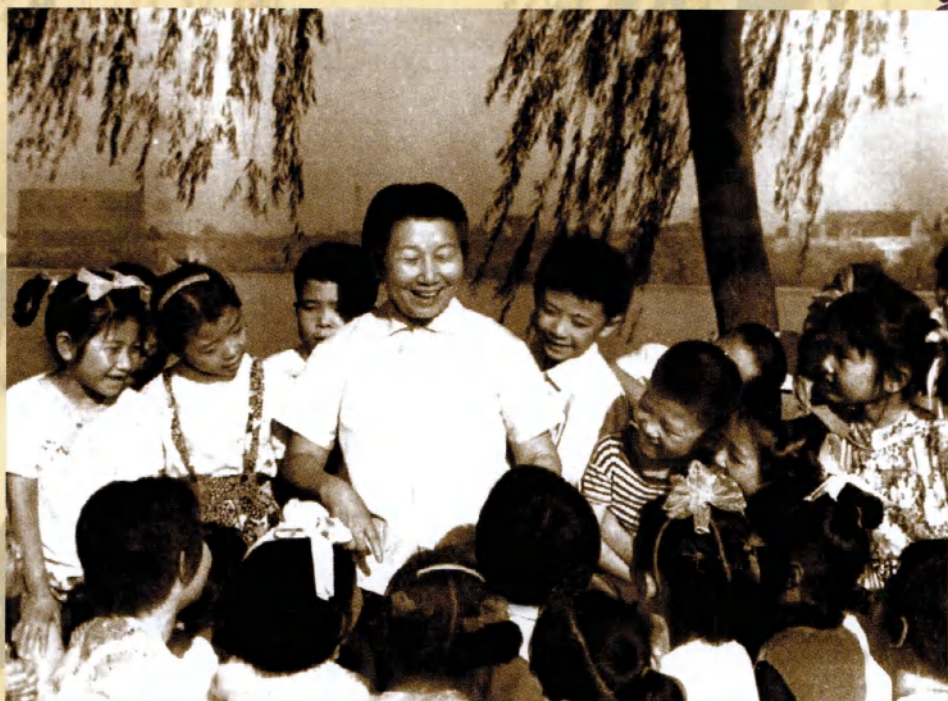
斯霞是孩子们的知心大朋友（1980年）