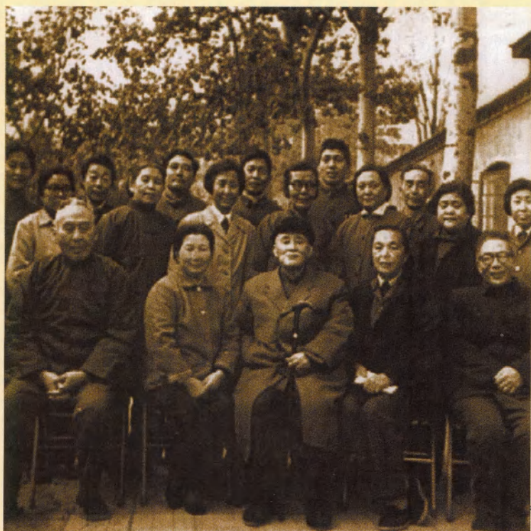
参加教材审查会议，与叶圣陶先生等合影