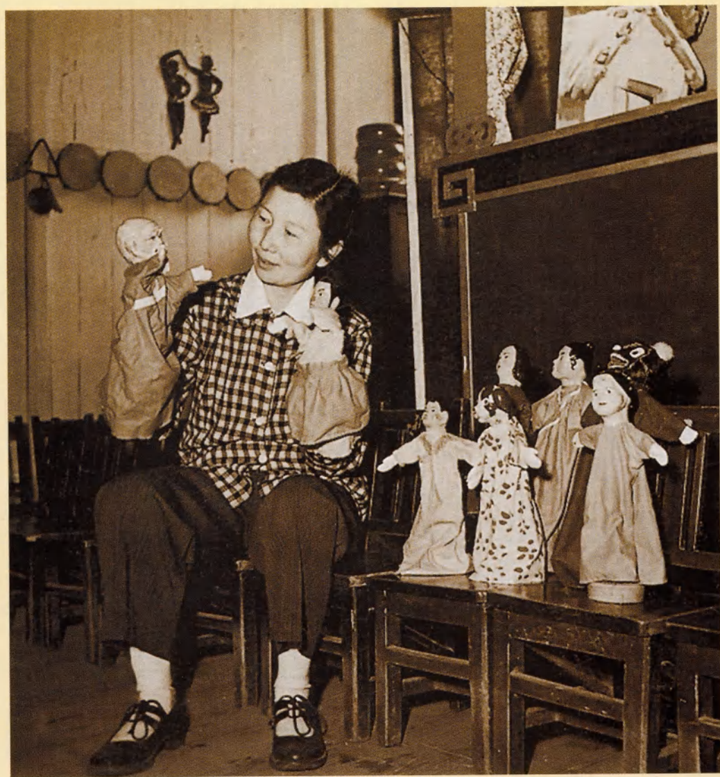
斯霞在练习操作木偶（1960年）