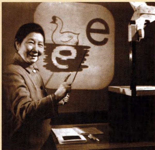
斯霞的汉语拼音教学（1978年）