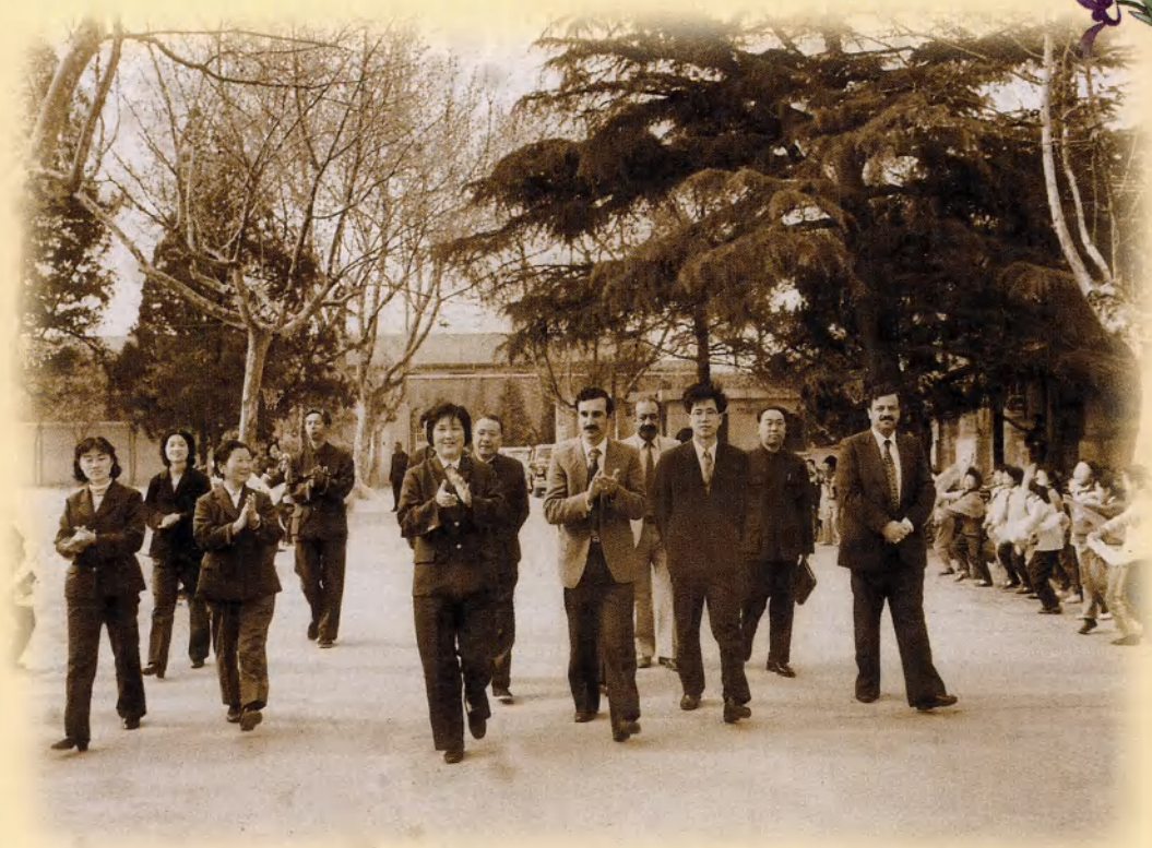
接待苏联教育考察团 (1982年)